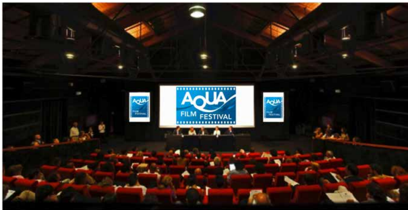
Casa del Cinema - Sala De Lux

Verranno istituiti premi e riconoscimenti sulla base della qualità artistica e del valore documentale delle opere.