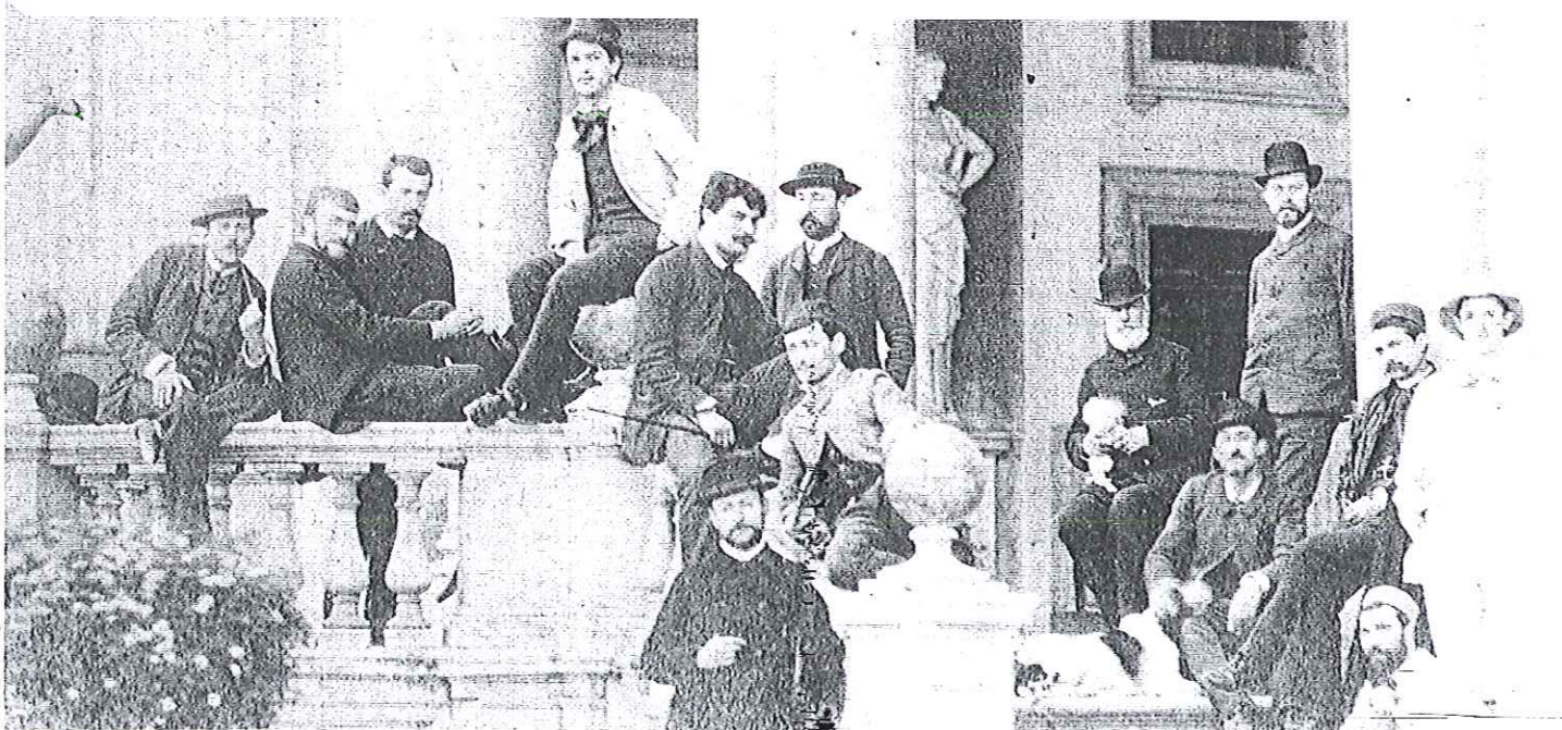
Debussy a Villa Medici a Roma, nel 1885 (al centro con la giacca bianca).