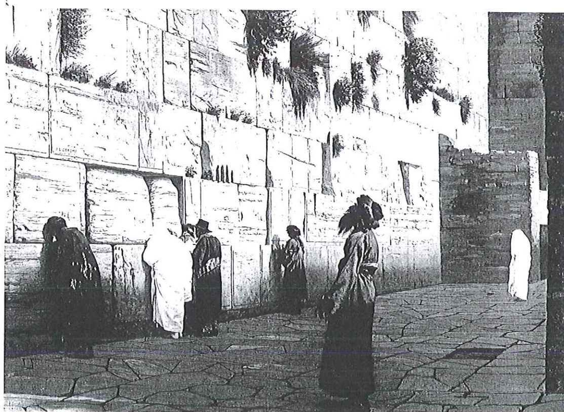
Il Muro del Pianto, a Gerusalemme, in un dipinto di Vasily Vereshchagin (1842-1904).